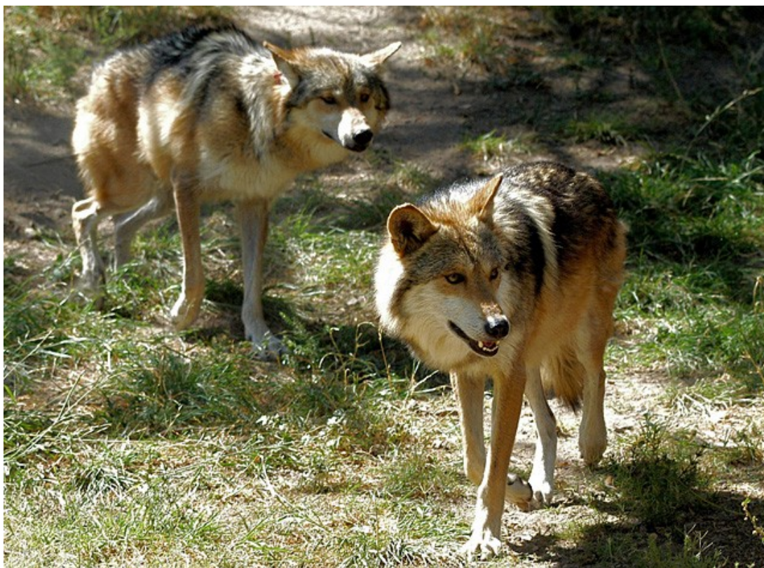
Farkas (Canis lupus)

Az Északi-középhegységben előforduló farkasok északi szomszédunktól, Szlovákiából érkeznek hazánkba.